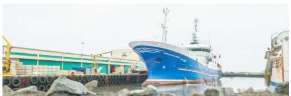
Lykilatvinnuvegir sveitarfélagsins: Ferðaþjónusta, landbúnaður og sjávarútvegur