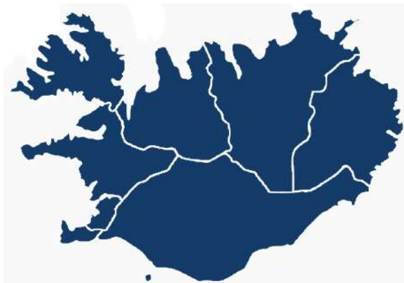
Suðurland í samhengi við Ísland (samband.is)