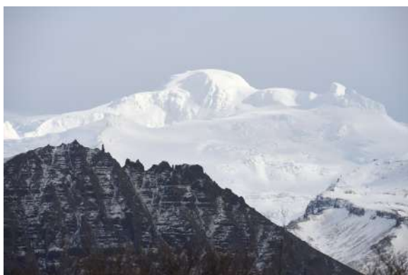
Sveitarfélagið í ríki Vatnajökuls