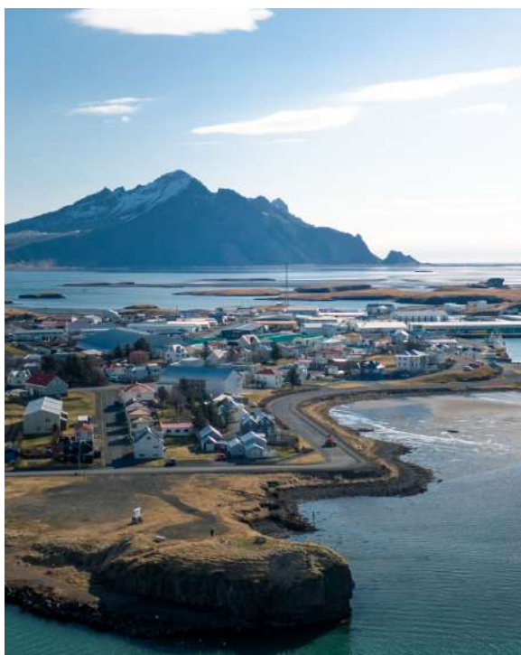
Hluti af landslagsumgjörð Hafnar